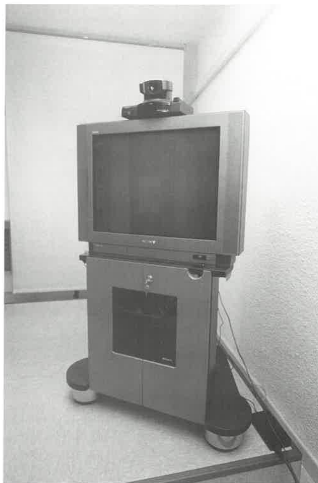
Tecnología de vanguardia para la enfermería de Huelva

Desde un punto de vista técnico, la videoconferencia ha precisado de cablear la sede colegial para instalar líneas digitales que posibilitan la comunicación.