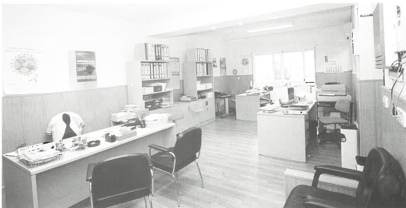
Mejores servicios para los colegiados.

modelación. Ha sido preciso efectuar el cambio de ventanas, instalación de parque y desplazamiento de tabiques. Todo ello ha permitido establecer una Base de publicaciones así como la puesta en escena de una Red interna de tipo informático que complementa la ya existente, tarea ésta efectuada al cablear la sede, así como la contratación de líneas RSDI que permiten la realización de videoconferencias y una mayor velocidad en Internet. En la oficina han quedado expuestos, de forma permanente, los carteles anunciadores de los distintos "Certámen de Enfermería Ciudad de Huelva" que organiza este Colegio Oficial.