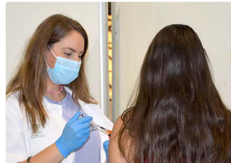
Enfermera vacunando en el FYCMA

A día de hoy, las enfermeras continúan avanzando en el plan de inmunización. En concreto, cerca de 500 profesionales se dejan la piel en el FYCMA para administrar cerca de 2.000 dosis diarias. “Aquí han participado enfermeras y enfermeros con una variabilidad de atención primaria, especializada, servicio de urgencias, jubilados e incluso estudiantes de último curso. Todos ellos han sido líderes de respuesta demostrando profesionalidad y entrega absoluta; aportando su