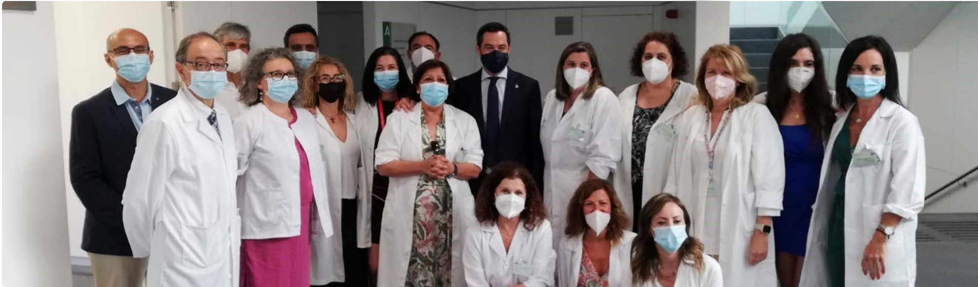
El presidente de la Junta, Juanma Moreno, con los profesionales del centro el día de su inauguración