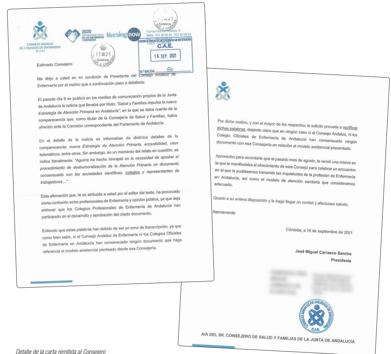
Detalle de la carta remitida al Consejero

El presidente del CAE reitera a Jesús Aguirre su ofrecimiento para celebrar un encuentro en el que poder transmitirle el modelo de atención sanitaria que las enfermeras y enfermeros andaluces consideran adecuado, así como las inquietudes de la profesión. Un nuevo modelo de atención primaria que debe comenzar con una adaptación de las plantillas y un aumento de las ratios enfermera-paciente, entre otras cuestiones. ■