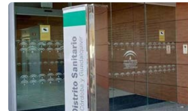
El CAE muestra su malestar por la falta de enfermeras en las nuevas Unidades de Gestión de Salud Pública del SAS