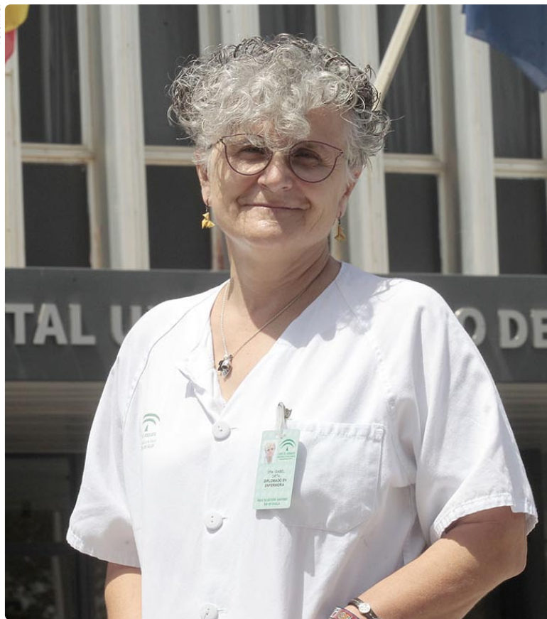
Beli trabaja en Medicina Preventiva en el Hospital de Valme desde hace un año