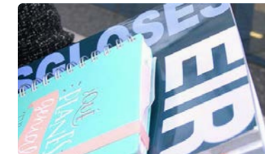
Las plazas EIR por especialidades ofertadas en Andalucía para 2022