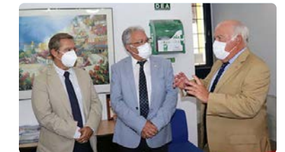
Córdoba traslada al Consejero de Salud un 'decálogo' de peticiones de las enfermeras