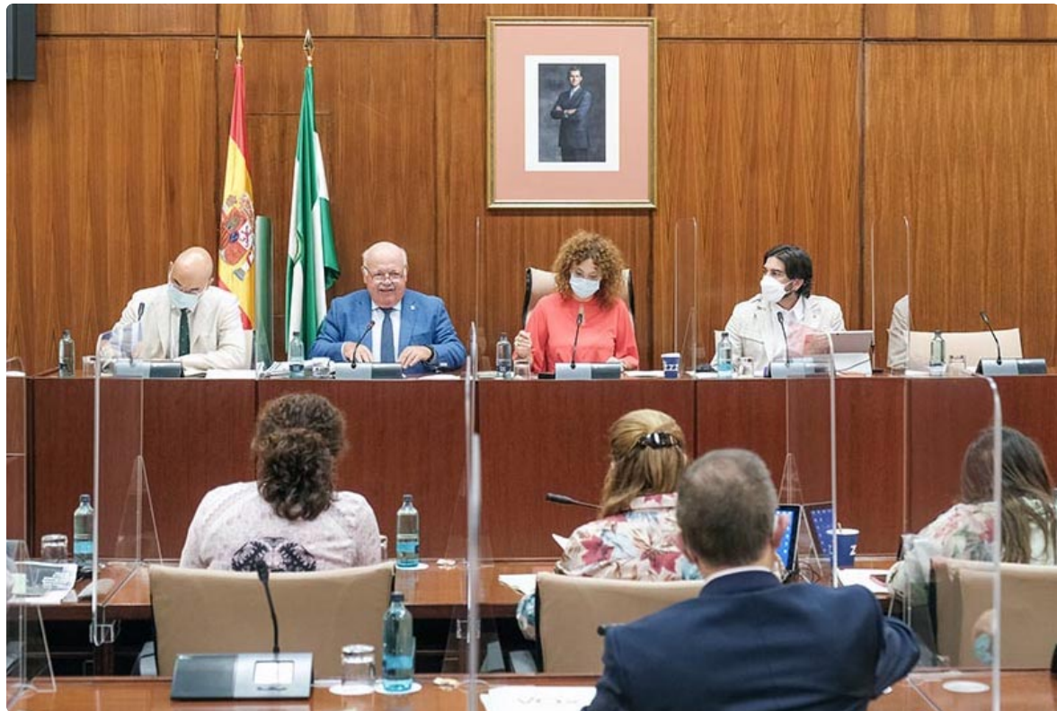
Comparecencia de Jesús Aguirre en la Comisión de Salud y Familias del Parlamento andaluz del pasado 9 de septiembre