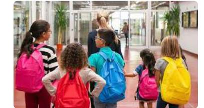
El rol de la enfermera escolar y el derecho a una educación igualitaria