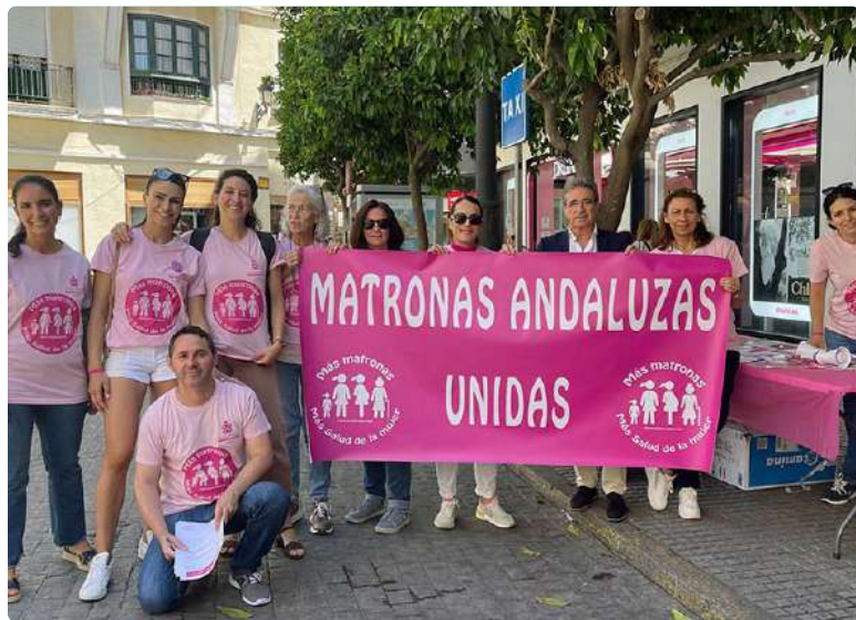
Las matronas recogiendo firmas en la Plaza del Palillero para reclamar más profesionales, en Cádiz