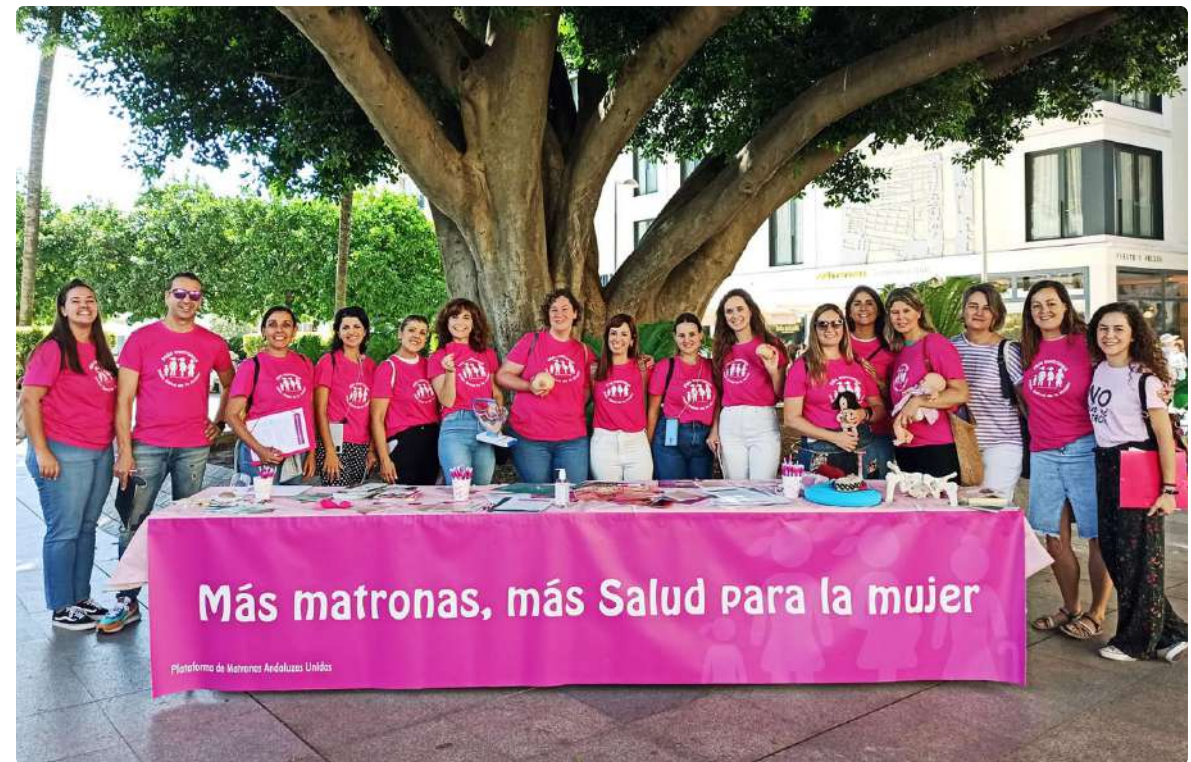
La 'Plataforma Matronas Andaluzas Unidas' en el centro de Sevilla