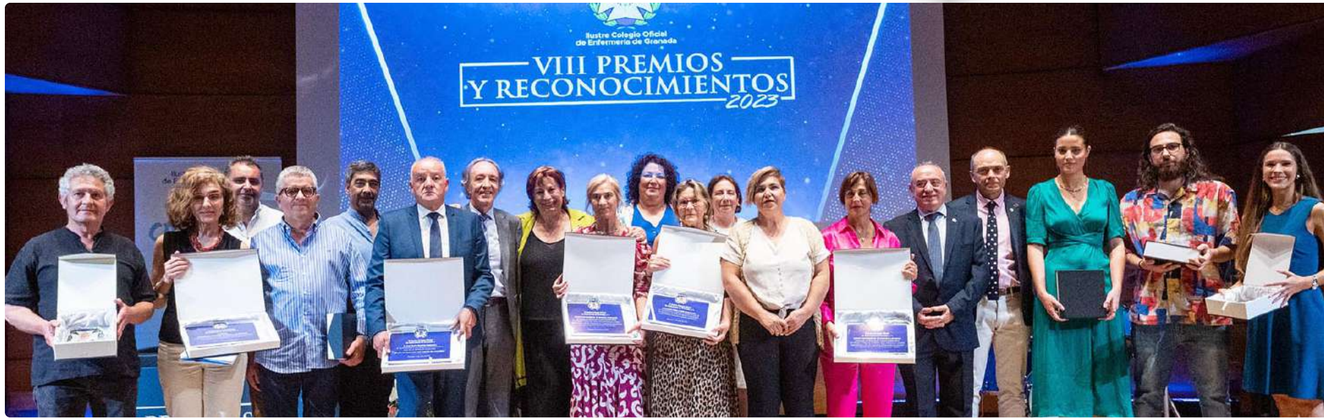
Foto de familia con los premiados de la VIII gala de Premios y Reconocimientos