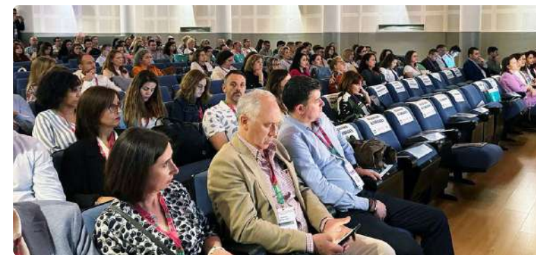
La mesa presidencial de las jornadas durante su inauguración

En resumen, la enfermería del trabajo desempeña un papel fundamental en la protección y promoción de la salud de los trabajadores. Estos profesionales son líderes en la implementación de estrategias de mejora en salud en entornos laborales, empoderando a los trabajadores y a las organizaciones para crear ambientes laborales seguros y saludables. Una labor totalmente fundamental dentro de la profesión enfermera. ■