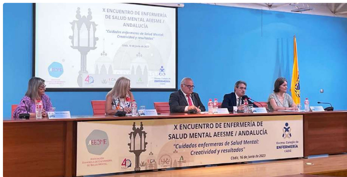
Mesa inaugural. - Desde la izda: la decana de la Facultad de Enfermería y Fisioterapia; la delegada de Salud y Consumo en Cádiz; el presidente de AEESME; el presidente del Colegio de Enfermería de Cádiz y la delegada de AEESME Andalucía