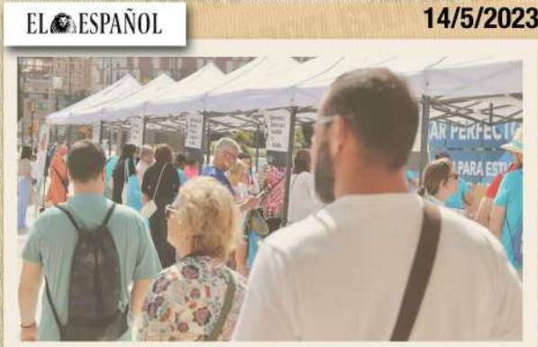
Imagen de la feria de salud organizada por el Colegio de Enfermería de Málaga.