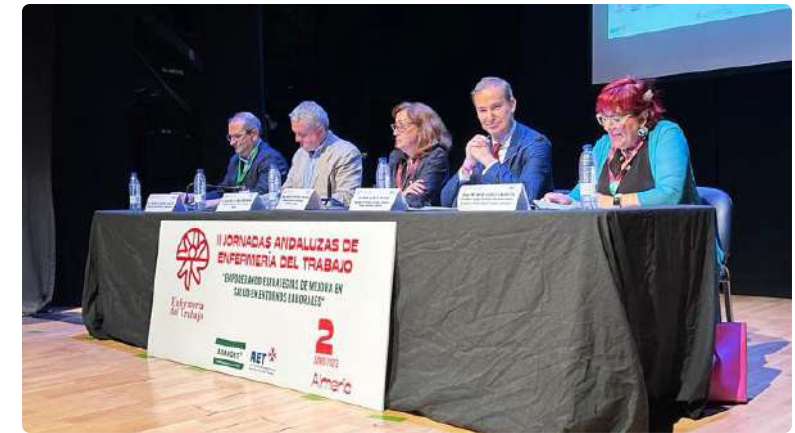
La mesa presidencial de las jornadas durante su inauguración

La enfermería del trabajo se enfoca en la promoción y el manteni-