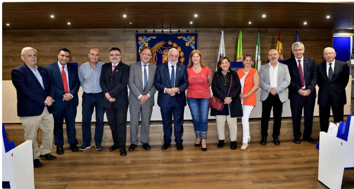
Miembros de la Junta de Gobierno del ICOEJ y ponentes de la Jornada de Historia

Estas Jornadas sobre Historia de la Enfermería en la Edad Moderna y Contemporánea se encuentran dentro de la intensa actividad formativa que lleva a cabo el Colegio de Enfermería a lo largo de todo el año, en la que participan miles de profesionales anualmente. ■