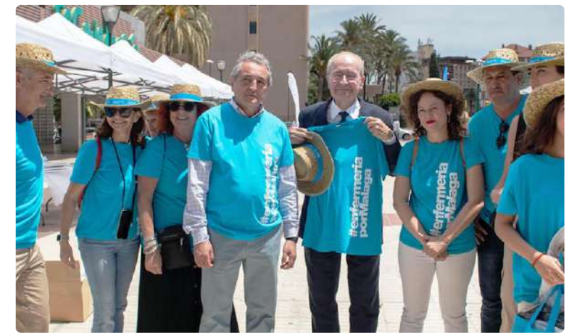
Francisco de la Torre, alcalde de Málaga, visita el II Bazar del Cuidado

Demostrar su compromiso con la promoción de la salud