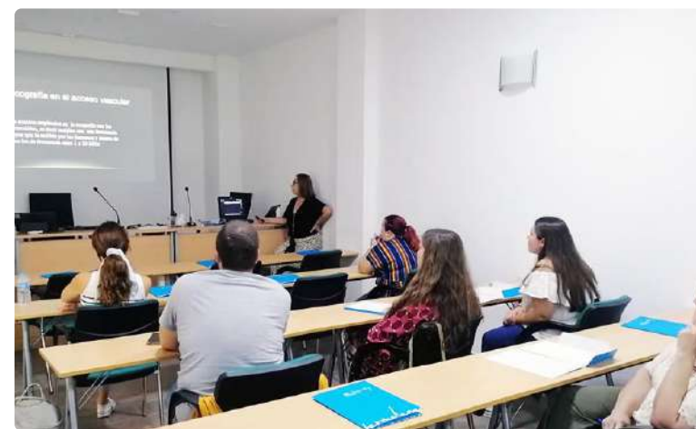
Enfermeras malagueñas asisten al curso "La ecografía en el acceso vascular"

Además, este curso no solo ha brindado a los participantes conocimientos y habilidades fundamentales en el área, sino que también se ha basado en la simulación como parte integral de la formación. A través de la simulación, los profesionales han tenido la oportunidad de practicar técnicas de canalización venosa utilizando la ecografía, lo que les ha permitido adquirir experiencia práctica en un entorno seguro y controlada. Como ha puesto en valor la docente del curso "esta metodología de enseñanza proporciona una oportunidad única de aprendizaje interactivo y fortalece la confianza de los participantes en la aplicación de estas habilidades en situaciones reales". ■