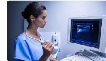
"Andalucía necesita alcanzar unas ratios de matronas adecuadas"