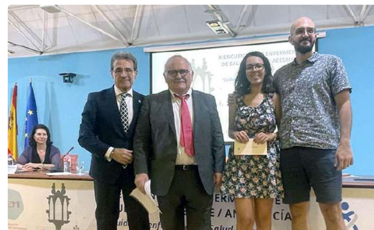
El Colegio de Enfermería de Cádiz patrocinó los dos premios entregados en este Encuentro