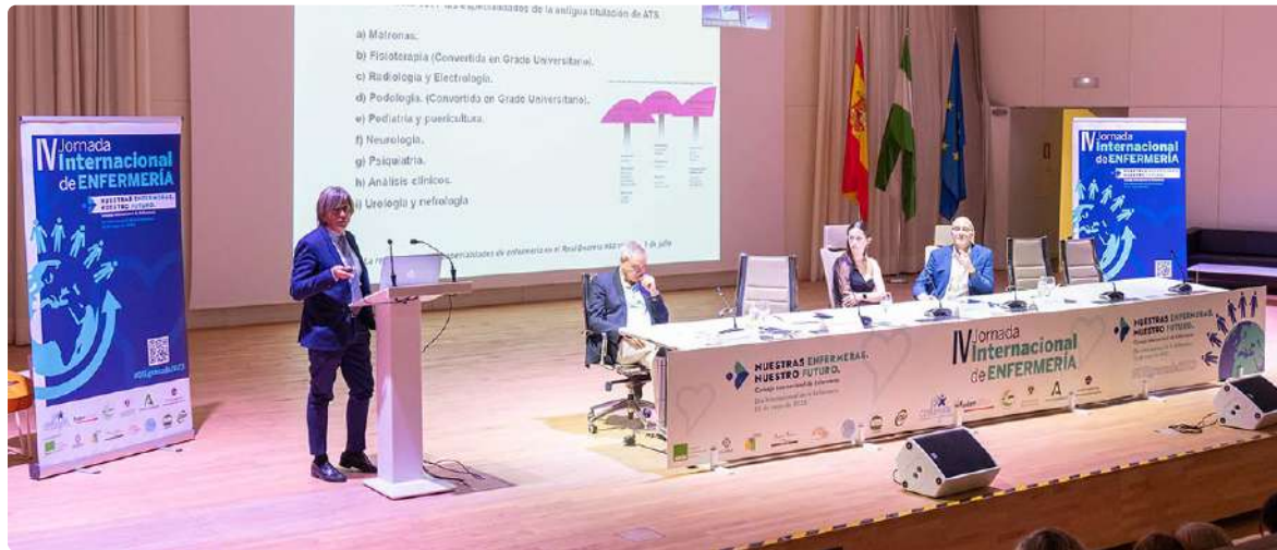
Granada reivindica el papel enfermero en avances de salud global

Granada celebró el Día Internacional de la Enfermera con un congreso también internacional dedicado a reivindicar el papel protagonista de estos profesionales en el camino para alcanzar la salud global