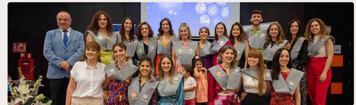
Nuevos especialistas, en un acto de homenaje