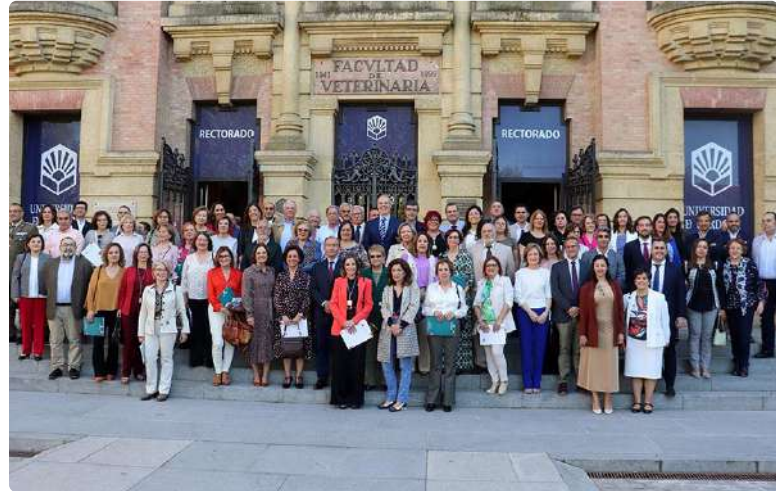
Foto de familia de los asistentes a la celebración del Patrón de la Enfermería, San Juan de Dios, organizada por el Colegio de Córdoba

El Colegio de Enfermería de Córdoba ha resaltado su apuesta por el desarrollo profesional y competencial de la profesión. Además, el Colegio reclama su participación en la Comisión Provincial de Agresiones a profesionales del