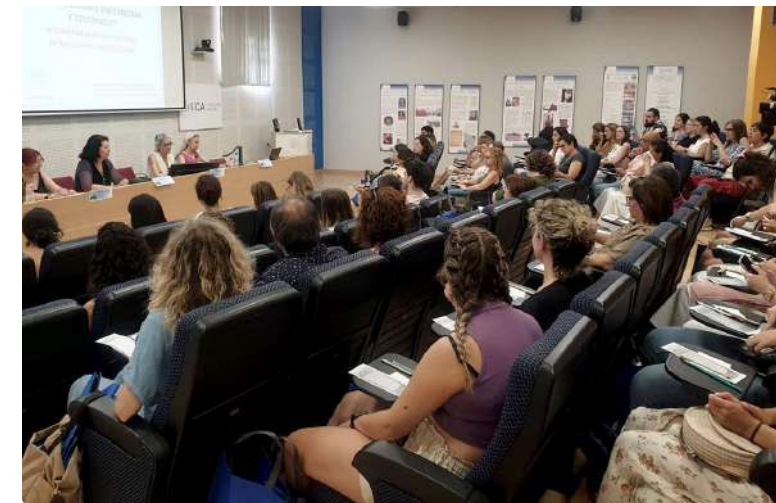
Éxito en la celebración del taller 'Zentangle'

En este Foro debatieron temas como como 'La enfermera de Salud Mental y cambios necesarios en la