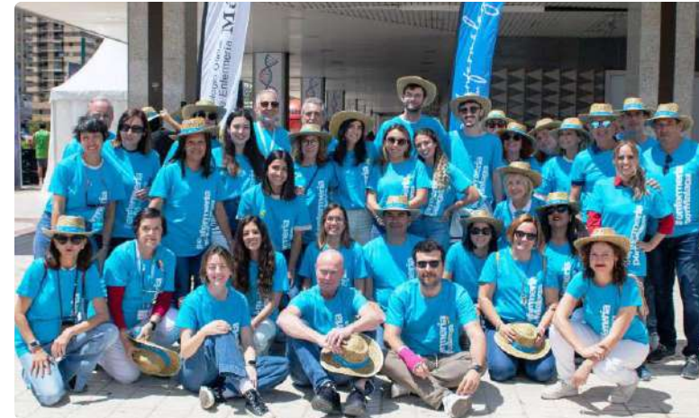
Profesionales sanitarios que participaron en la celebración del II Bazar del Cuidado

En la mesa del Colegio de Enfermería de Málaga/AMA se ofreció información relevante sobre la institución. En la mesa de “Una Matrona en tu vida”, se dio a conocer el papel de las matronas y su labor en la atención a la salud reproductiva y sexual de la mujer. En la carpa dedicada a “Enfermería Pediátrica para crecer seguro”, se profundizó en temas como la obesidad infantil y el sedentarismo en edades tempranas y la importancia de una enfermera espe-