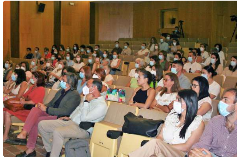
Detalle del público asistente

Durante este ‘Encuentro’ también se ha evidenciado la importancia de la figura de las enfermeras gestoras de casos de residencias de mayores puesta en marcha el pasado año desde Atención Primaria por el Servicio Andaluz de Salud (SAS), y de las propias enfermeras que trabajan en las 87 residencias (públicas, concertadas y privadas) que existen en la provincia, y que atienden directa-