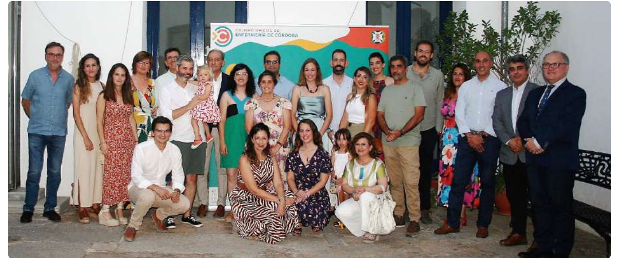
Foto de familia de los asistentes a este acto

EIR en el Reina Sofía, y en él se explican los principales cuidados postoperatorios prestados por el equipo de enfermeras de la UCI Pediátrica en una paciente intervenida de una cardiopatía compleja.