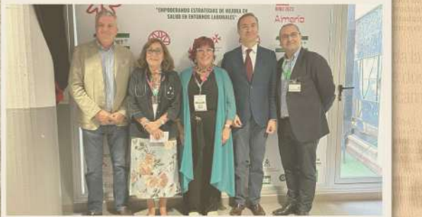
Algunos de los participantes en las jornadas. LA VOZ

Se celebran en la Escuela Municipal de Música y Arte de la ciudad