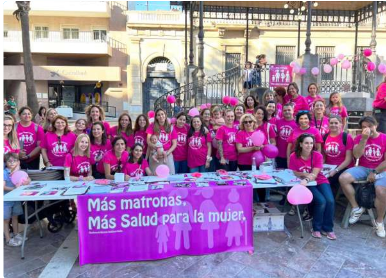
Celebración Día Internacional de las Matronas en Huelva