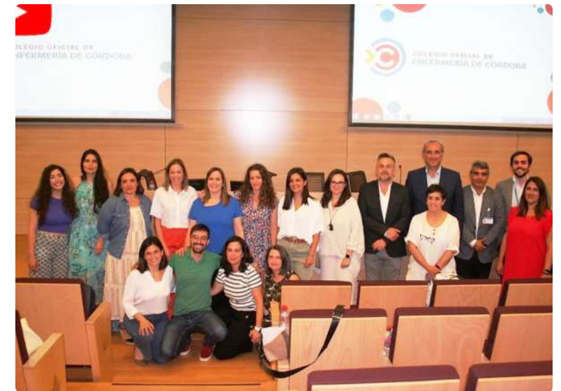
Foto de familia de las matronas participantes en el acto junto a miembros de la Ejecutiva del Colegio de Enfermería de Córdoba y responsables del Hospital San Juan de Dios

Por su parte, el Colegio de Enfermería de Granada celebró esta efeméride con talleres y charlas. El programa contó con propuestas para acercar la labor de las especialistas a la sociedad. Una vez más, este órgano colegial sumó la colaboración de la Asociación Andaluza de Matronas para "reivindicar el papel protagonista de las matronas con un programa enmarcado bajo el lema 'Por y para las mujeres'. Así, hasta el 7 de mayo, un grupo de especialistas dedicaron la jornada a talleres y charlas centradas en las embarazadas, una propuesta de actividades gratuitas para celebrar la profesión.