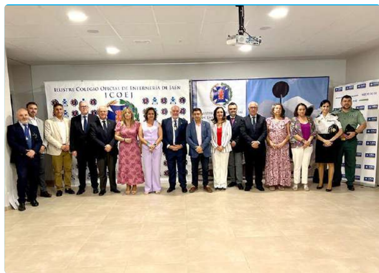
Autoridades junto al presidente y miembros de la Junta de Gobierno del ICOEJ

algunas de las mejoras que llevamos años solicitando, algunas tan peren-