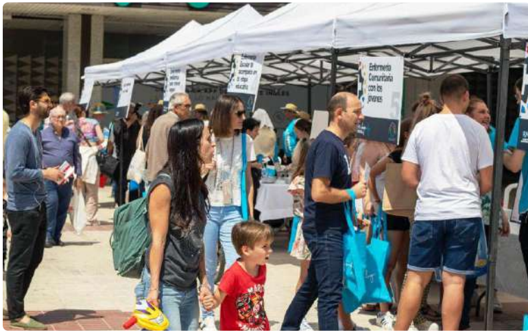
Instantánea tomada durante el desarrollo de la feria saludable

El II Bazar del Cuidado ha sido un éxito rotundo que ha permitido, un año más, reforzar la imagen de la Enfermería como un colectivo comprometido con el bienestar de la sociedad.