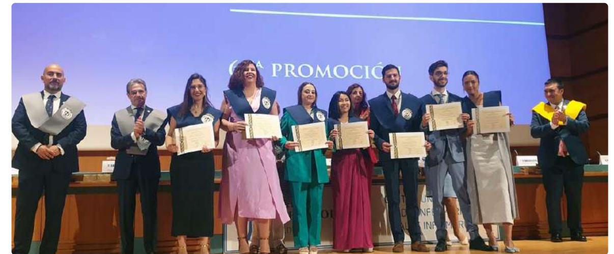
Graduación Centro Universitario de Enfermería Salus Infirmorum

El Colegio de Enfermería premió al 'Alumno más Destacado' de cada Facultad con la gratuidad de un curso de Experto Universitario en Cirugía Menor