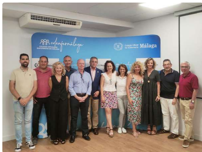
Junta de Gobierno del Colegio de Enfermería de Málaga en la celebración de la Junta General de Colegiados

A continuación, se han resaltado los resultados positivos de la corporación y se han compartido las principales líneas de trabajo llevadas a cabo durante ese periodo, haciendo hincapié en el compromiso de transparencia que mantiene la institución con sus profesionales y la sociedad. Además, se ha puesto en relieve el significativo avance que se ha experimentado en el ámbito de la