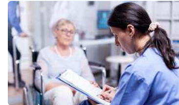
La Enfermería andaluza ante los nuevos retos de salud global