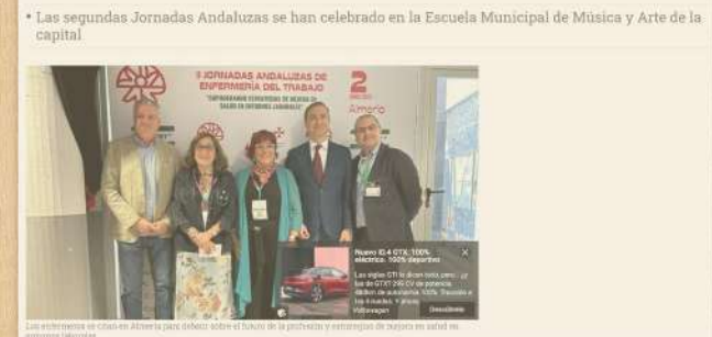
Los enfermeros se reúnen en Almería para debatir sobre el futuro de la profesión y estrategias de trabajo en salud en diferentes laboratorios.

Las segundas Jornadas Andaluzas se han celebrado en la Escuela Municipal de Música y Arte de la capital.