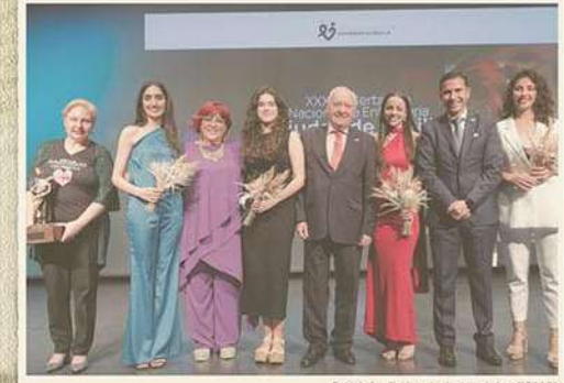
Foto de familia de todos los premiados.

El Colegio de Enfermería de Sevilla reconoce la investigación en sus galardones anuales