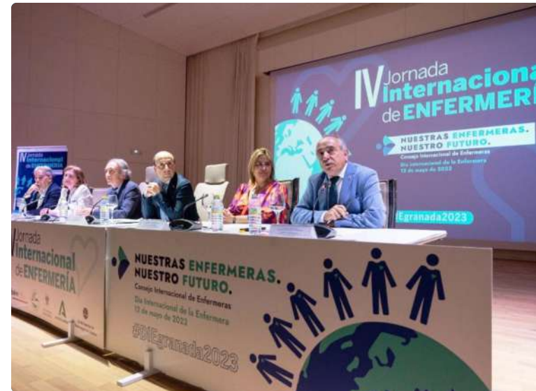
Mesa institucional en la inauguración de la Jornada Internacional de Granada

que “las condiciones de los profesionales que ejercen esta profesión sean dignas para que el cuidado a los pacientes sea el mejor posible. Pertenece a una profesión esencial que ha estado ahí cuando se nos ha necesitado y, sinceramente, no sentimos el apoyo ni el respaldo esperado”, ha señalado la presidenta.