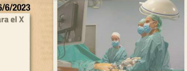
Varios médicos operando en un hospital de Málaga.

En los últimos diez años se ha duplicado el volumen de enfermeros o de fisioterapeutas y ha crecido un 46% el de médicos.