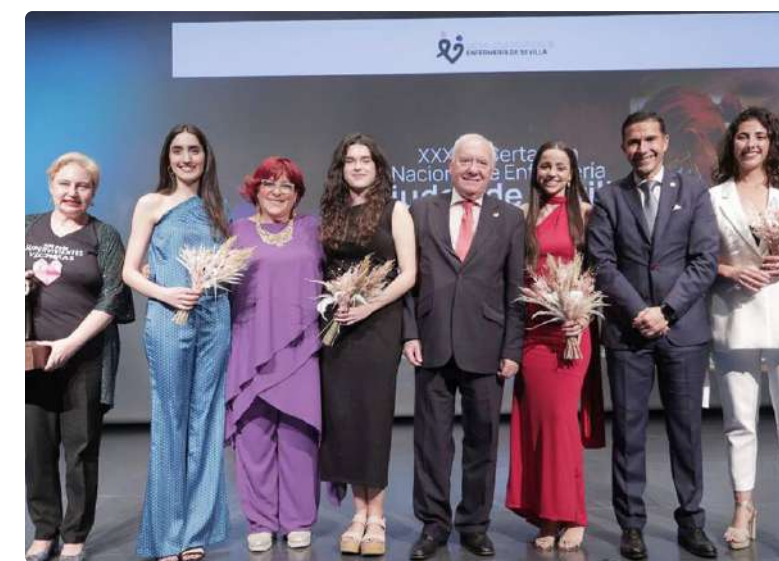
Premiados junto a representantes de las enfermeras sevillanas

La Fundación Ana Bella fue reconocida en la XXX edición del Premio San Juan de Dios, por su implicación con las mujeres maltratadas. Esta red de mujeres supervivientes actúa en 82 países como una solución global contra la violencia de género. Asimismo, aporta soluciones eficaces mediante la involucración de distintos agentes para actuar en el cambio social frente a la violencia de género y generen cambios sistémicos para la construcción de una sociedad en igualdad. ■