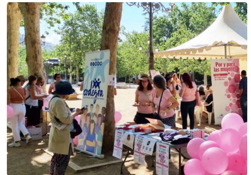
Por y Para las Mujeres en Granada