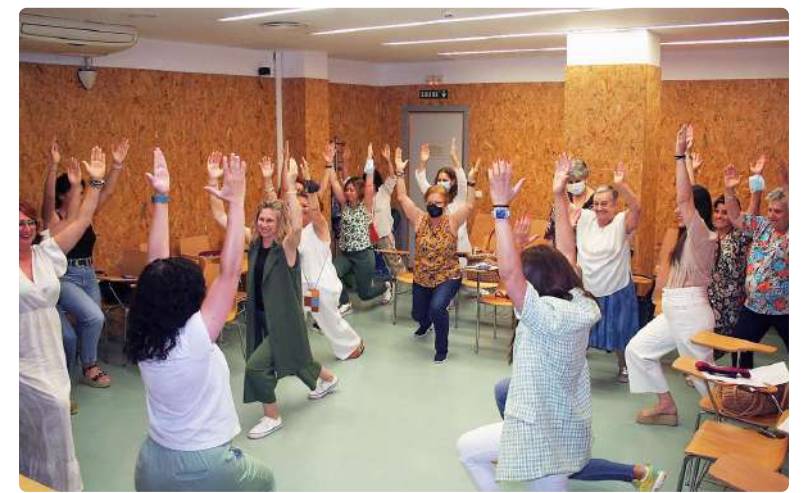
Imagen de uno de los talleres formativos.