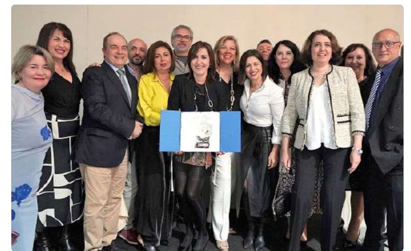
Celebración del Día Internacional de la Enfermería en el COEH

en salud, contribuyendo de manera significativa a la prevención, el diagnóstico, el tratamiento y el cuidado de las personas. “Este día representa una oportunidad única para mostrar al mundo que la Enfermería es una profesión vital en el cuidado de la salud, y que su labor diaria contribuye al bienestar y la calidad de vida de la sociedad en su conjunto. La dedicación y el compromiso de las enfermeras en su trabajo diario no solo se refleja en la atención a los pacientes, sino también en la mejora constante de