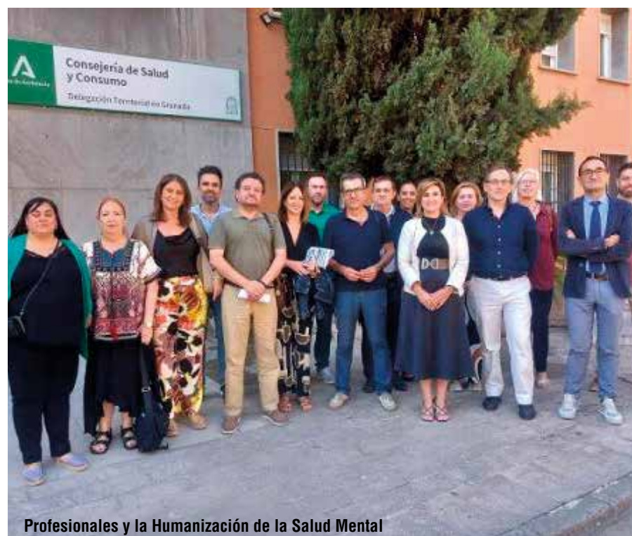
Profesionales y la Humanización de la Salud Mental