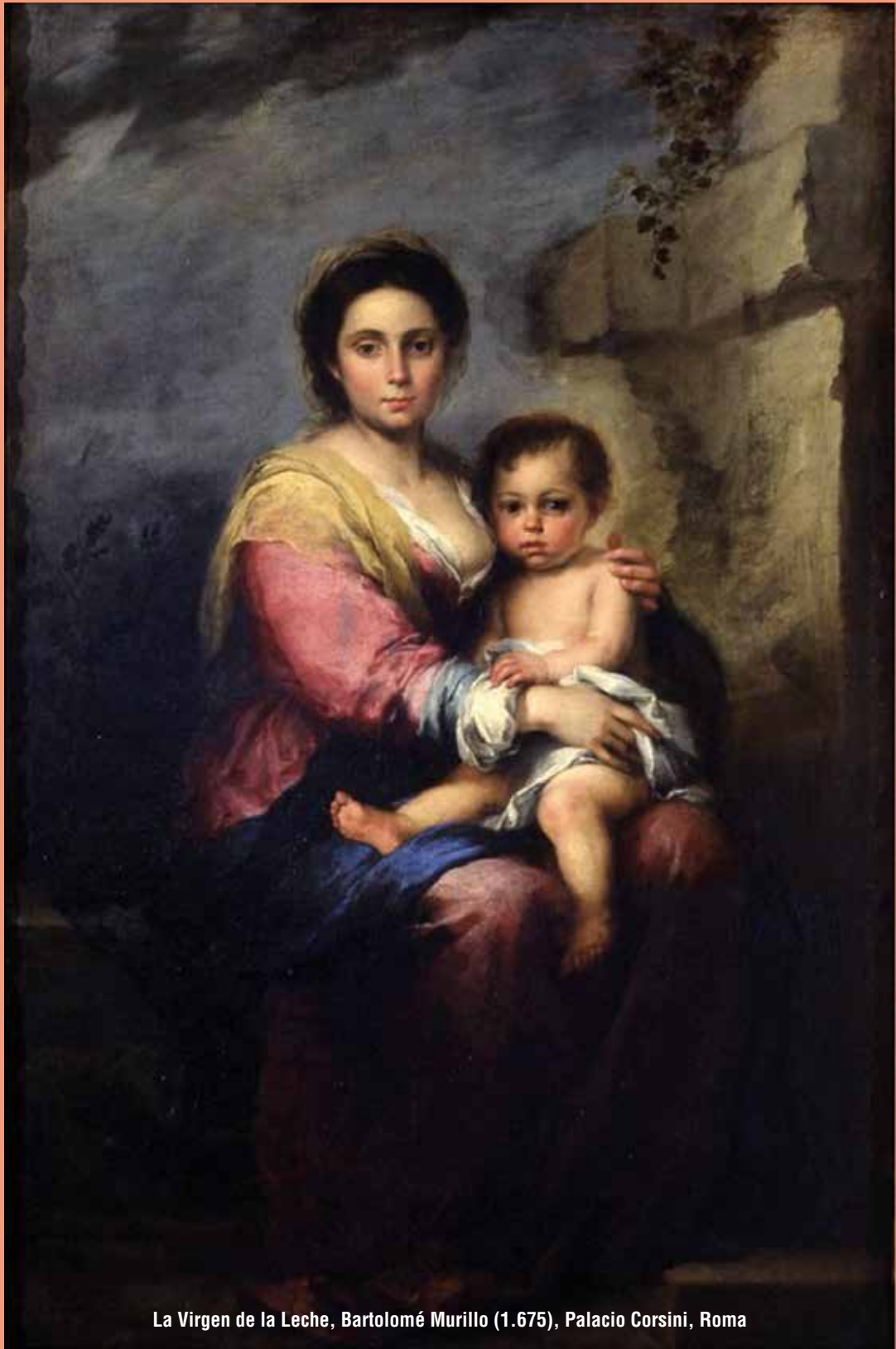
La Virgen de la Leche, Bartolomé Murillo (1.675), Palacio Corsini, Roma

EL COLEGIO DE ENFERMERÍA DE HUELVA QUIERE HACER LLEGAR A LA PROFESIÓN SUS MEJORES DESEOS PARA VIVIR CON SALUD Y FELICIDAD LA NAVIDAD Y AÑO 2.024.