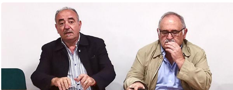
El presidente del colegio granadino recordó que tanto la Consejería como el SAS se comprometieron a implementar la especialidad sin que se haya materializado

El Colegio de Enfermería de Granada conmemora con una mesa redonda el Día Mundial de la Salud Mental y profundiza en los retos de futuro de esta especialidad en un año dedicado al suicidio.