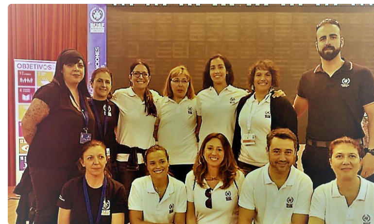
Unidad Médica de Asistencia de BUSF