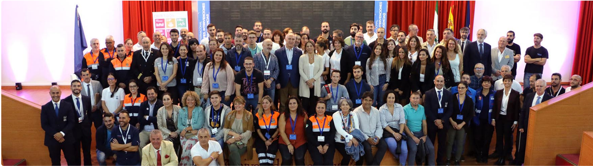
Foto final del congreso