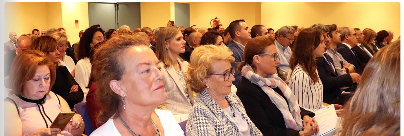
Asistentes a la cita