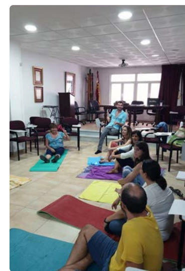
Curso de 'Técnicas de relajación: aprende a relajarte y a relajar a otros'

Del 25 al 29 de noviembre se celebra el curso Atención de Enfermería al paciente con problemas neoplásicos . Posteriormente llegará el turno del curso Cirugía menor para Enfermería: suturas y reparación de heridas , desde el 9 hasta el 13 de diciembre. ■