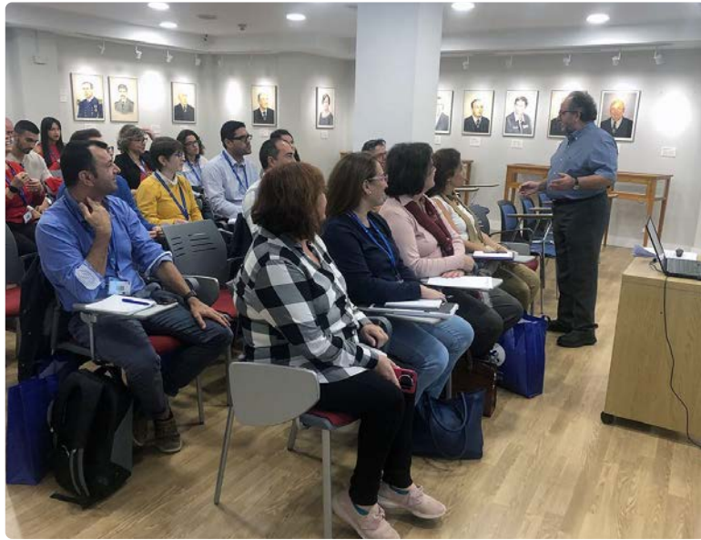
Tercer Taller: 'Cómo publicar con éxito artículos de investigación cualitativa'