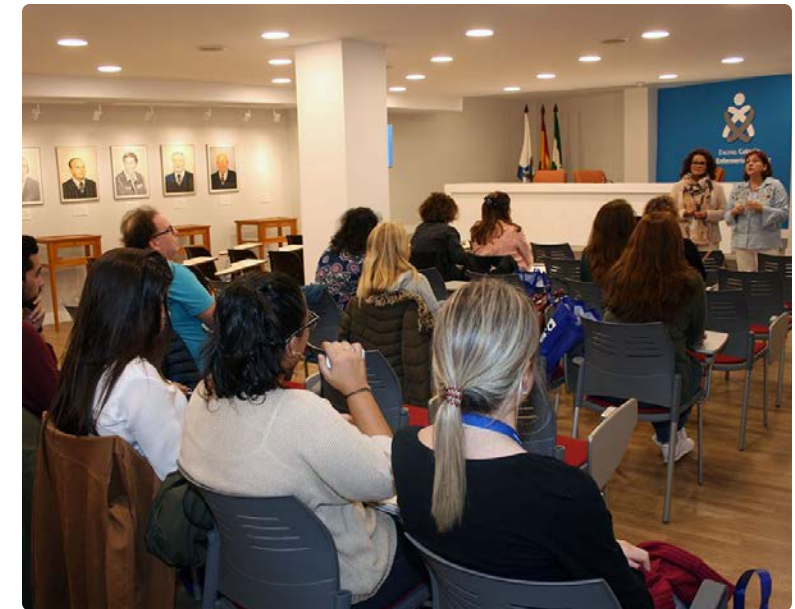
Primer Taller: 'La Enfermera como promotora de ensayos clínicos'