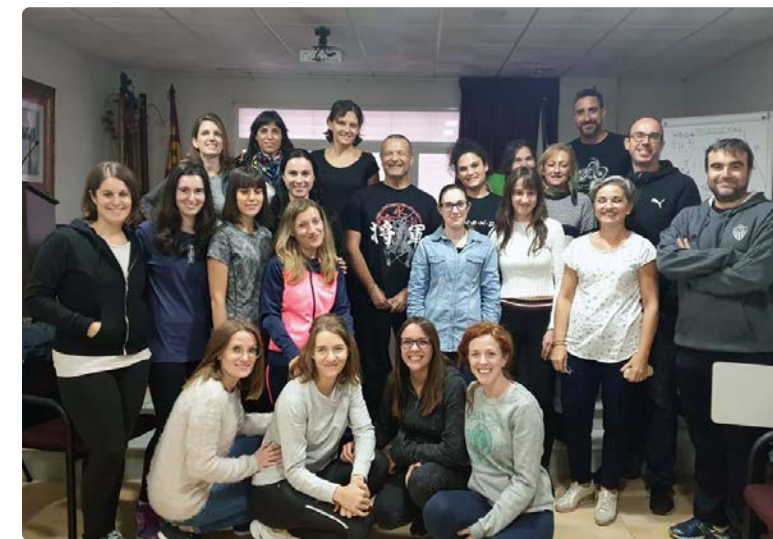
Foto de familia de la formación en defensa personal

Las sesiones formativas, que han estado divididas en teóricas y prácticas, se desarrollaron en la propia sede del Colegio de Enfermería de Almería, en la Avenida Pablo Igle-