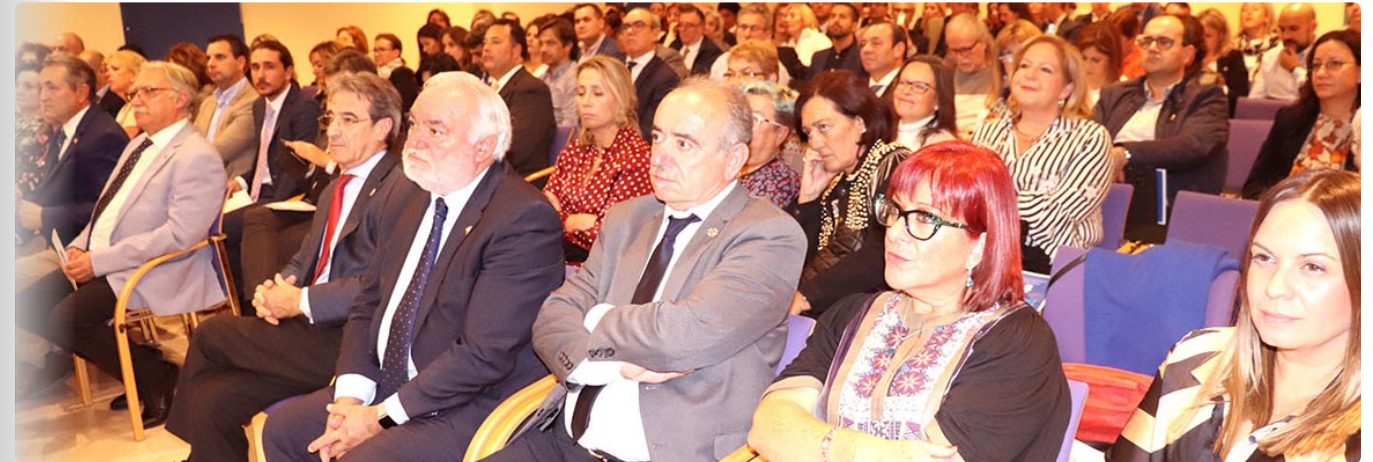
Presidentes de colegios de Enfermería andaluces asistieron a la presentación acompañados de miembros de sus comisiones ejecutivas