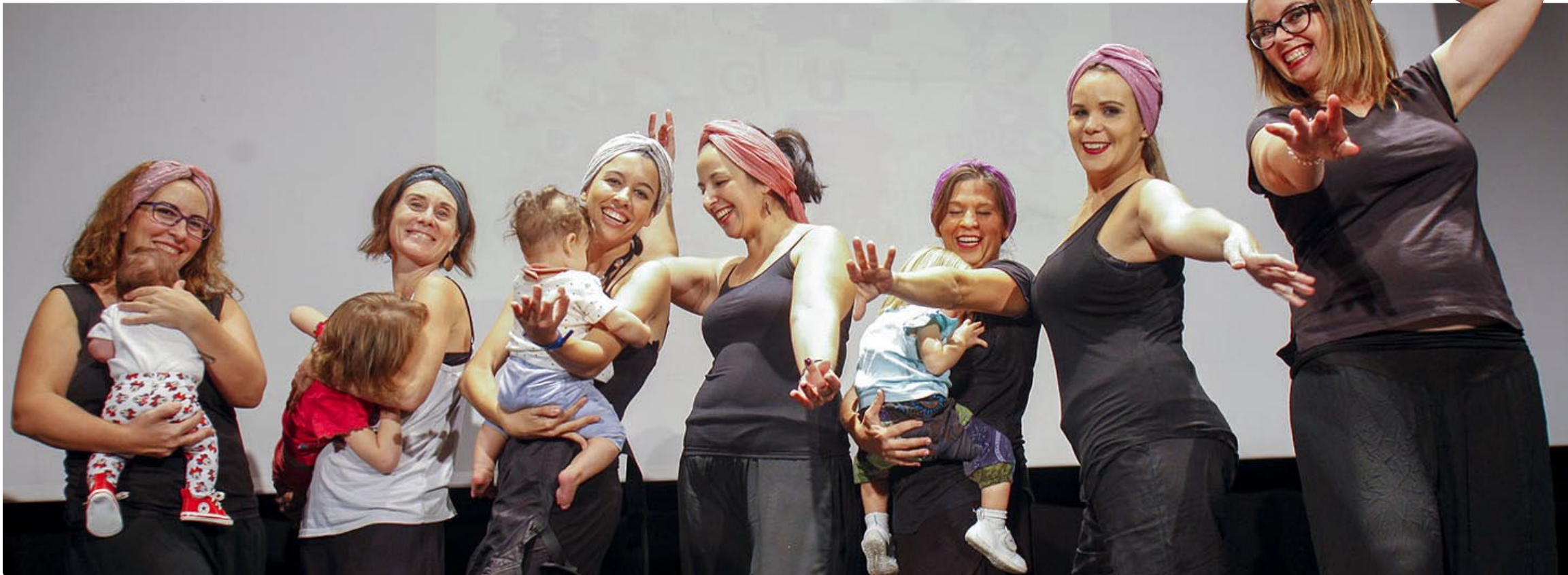
Madres que han participado en el baile Sunny Sunny Sunny, portando a sus hijos durante la Semana Mundial de la Lactancia Materna de este año