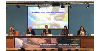
Más de 300 profesionales participan en las IV Jornadas sobre Conocimiento Enfermero, organizadas por el colegio de Cádiz