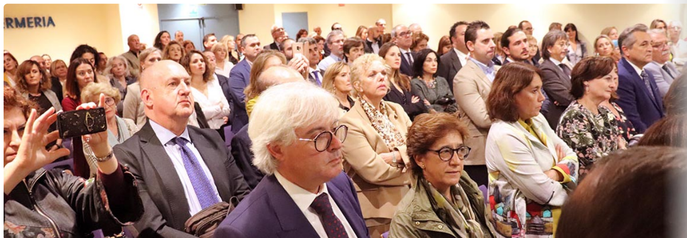
Al finalizar el acto, todos se pusieron en pie para escuchar el himno de la Enfermería