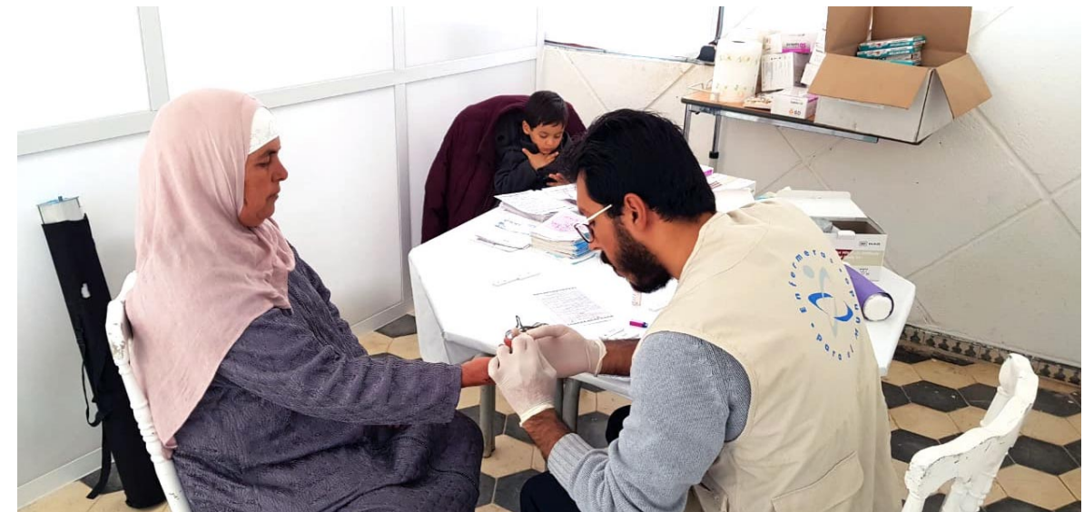
Realización de análisis glucémico en la caravana de fin de año

aumento de embarazos no deseados, el abandono escolar, o más pobreza y exclusión.