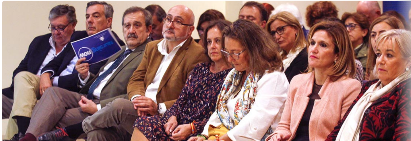
En la primera fila del público, delegadas territoriales de Salud, la viceconsejera y otros directivos de la Consejería