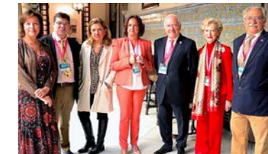
Las enfermeras cordobesas celebran una jornada de actualización en vacunas, patrocinada por el CAE