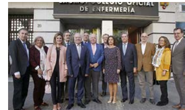
El grupo Nursing Now Consejo Andaluz de Enfermería contó con un fuerte respaldo y numerosas adhesiones en su presentación