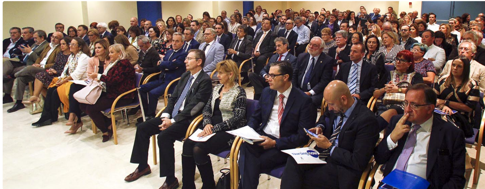
En las primeras filas del público, además de los representantes de la Consejería y los ponentes de la mesa redonda, presidentes y miembros de las juntas de colegios de enfermería andaluces y del Pleno del CAE

En esa misma línea, el también presidente del CAE, se preguntó: