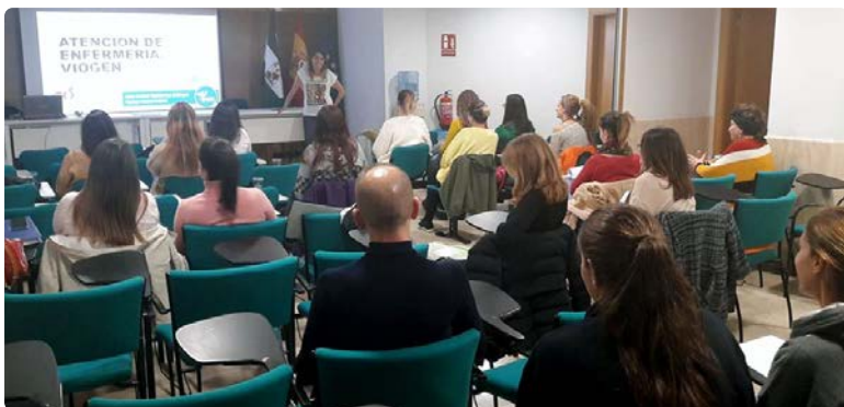
Instantánea de la impartición del curso

Un curso teórico y práctico les ha permitido actualizar los conocimientos ante este tipo de maltrato y actualizar el protocolo de atención.