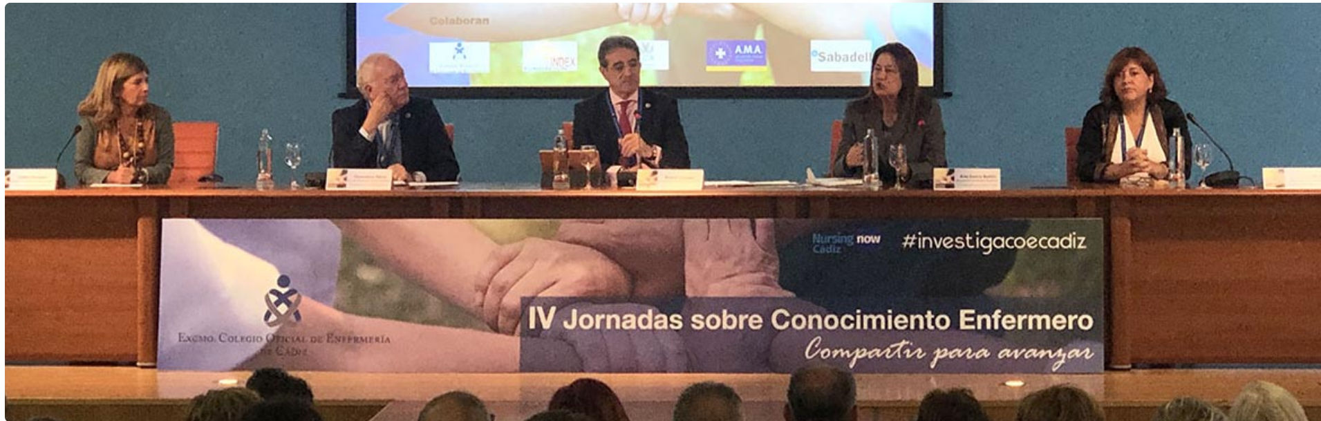
Inauguración. Desde la izda. a dcha.: la delegada de Salud; el presidente del CGE y del CAE; el presidente del Colegio de Enfermería de Cádiz; la vicerrectora de CCSS de la UCA y la responsable de la Unidad de Promoción y Apoyo a la Investigación