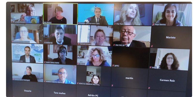
Vista general de los ponentes, organizadores y asistentes al evento