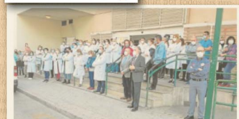
Fallece una enfermera del centro de salud del Zaidín por coronavirus