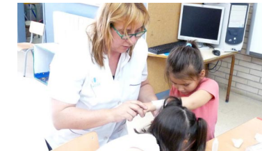
El CAE insta a la Consejería de Salud y Familias a la implantación de la enfermera escolar