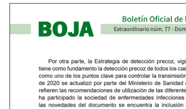
Posicionamiento contundente del CAE contra la Orden de medidas extraordinarias en el SAS aprobada por la Junta