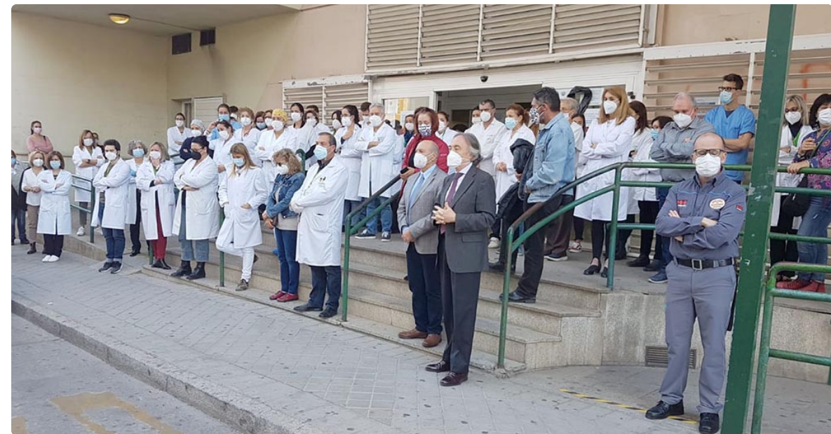
Concentración en recuerdo de la enfermera del centro Zaidín Sur fallecida.