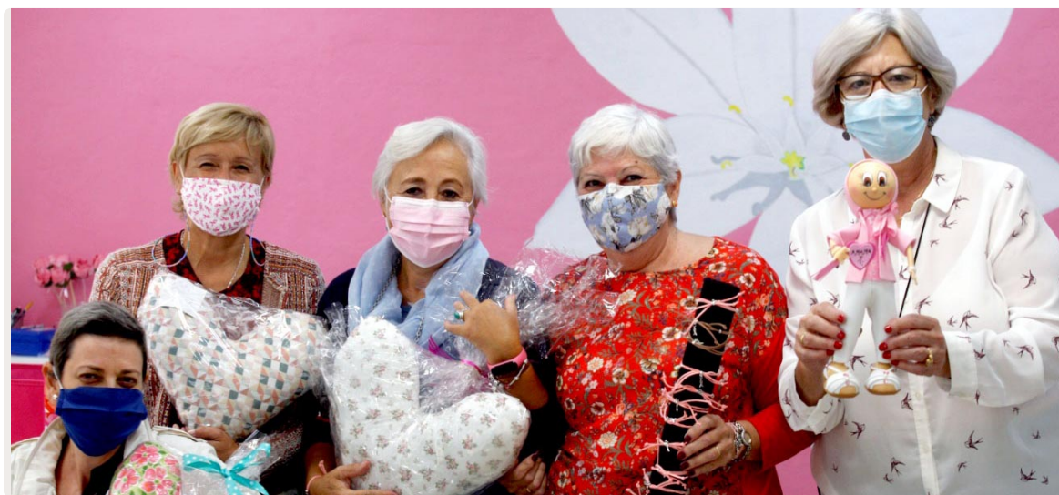
Miembros de la Junta Directiva de AMAMA Sevilla muestran los cojines solidarios para las mujeres que han sido intervenidas en quirófano y pulseras para recaudar fondos para la investigación