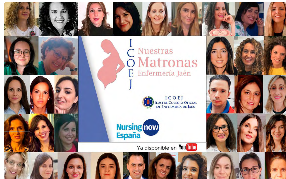
Matronas que han participado en esta plataforma

Los vídeos podrán consultarse en el canal de YouTube Nuestras Matronas Enfermería Jaén y en las redes sociales del Colegio Oficial de Enfermería de Jaén.