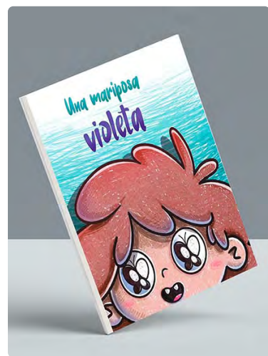
Portada del cuento 'Una Mariposa Violeta'.

Entre otras cuestiones, mediante el citado acuerdo de colaboración entre el Colegio de Enfermería de Jaén y ALUJA, la entidad colegial colaborará en la edición del cuento Una Mariposa Violeta , creado para que los más pequeños conozcan esta enfermedad.