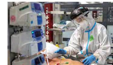
El Gobierno aprueba la declaración del COVID-19 como enfermedad profesional en sanitarios, reconocimiento demandado por el CAE