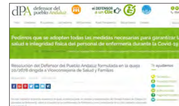
El Defensor del Pueblo Andaluz da la razón al CAE sobre la falta de materiales de protección