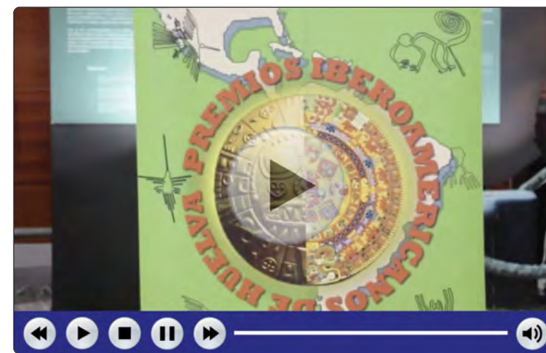
Si no puede ver el vídeo correctamente pinche aquí