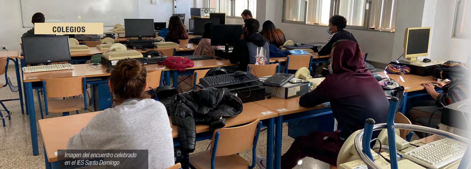
Imagen del encuentro celebrado en el IES Santo Domingo