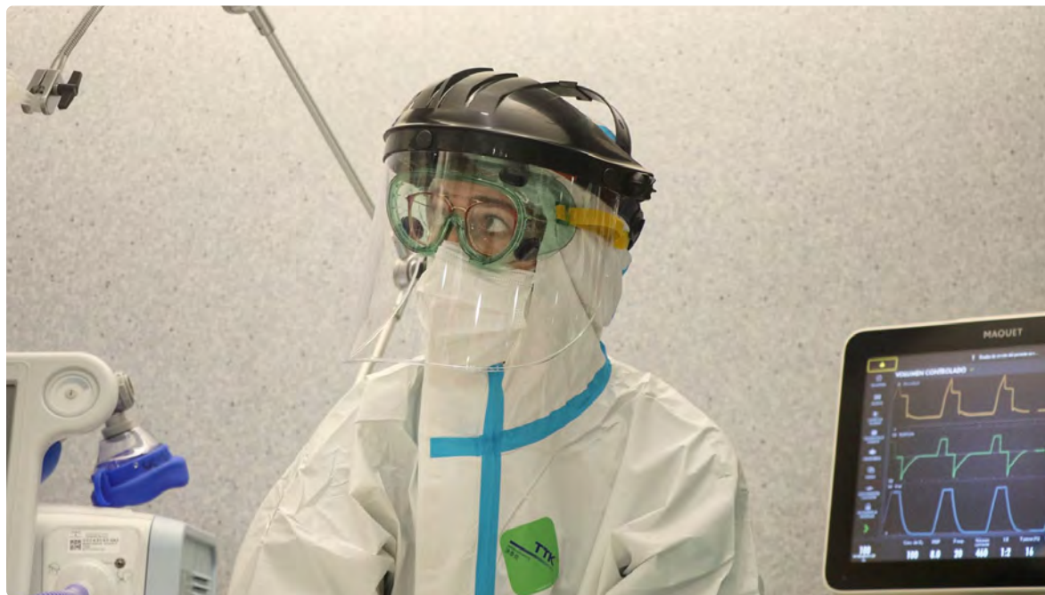
Los profesionales sí cuentan ya con más materiales de protección

Tras esta Resolución, el Pleno de Presidentes del CAE, que tanto ha denunciado estos hechos, ve reconocida su demanda y reclama que la falta de previsión, planificación y materiales de protección no vuelva a repetirse, y que la Consejería de Salud y Familias tome las medidas necesarias para garantizar la salud laboral y la efectiva protección de todo el personal sanitario. A pesar de todas estas circunstancias, los profesionales sanitarios andaluces continúan ofreciendo la mejor atención posible a los pacientes, en su compromiso inquebrantable con la salud y cuidado de la ciudadanía. ■