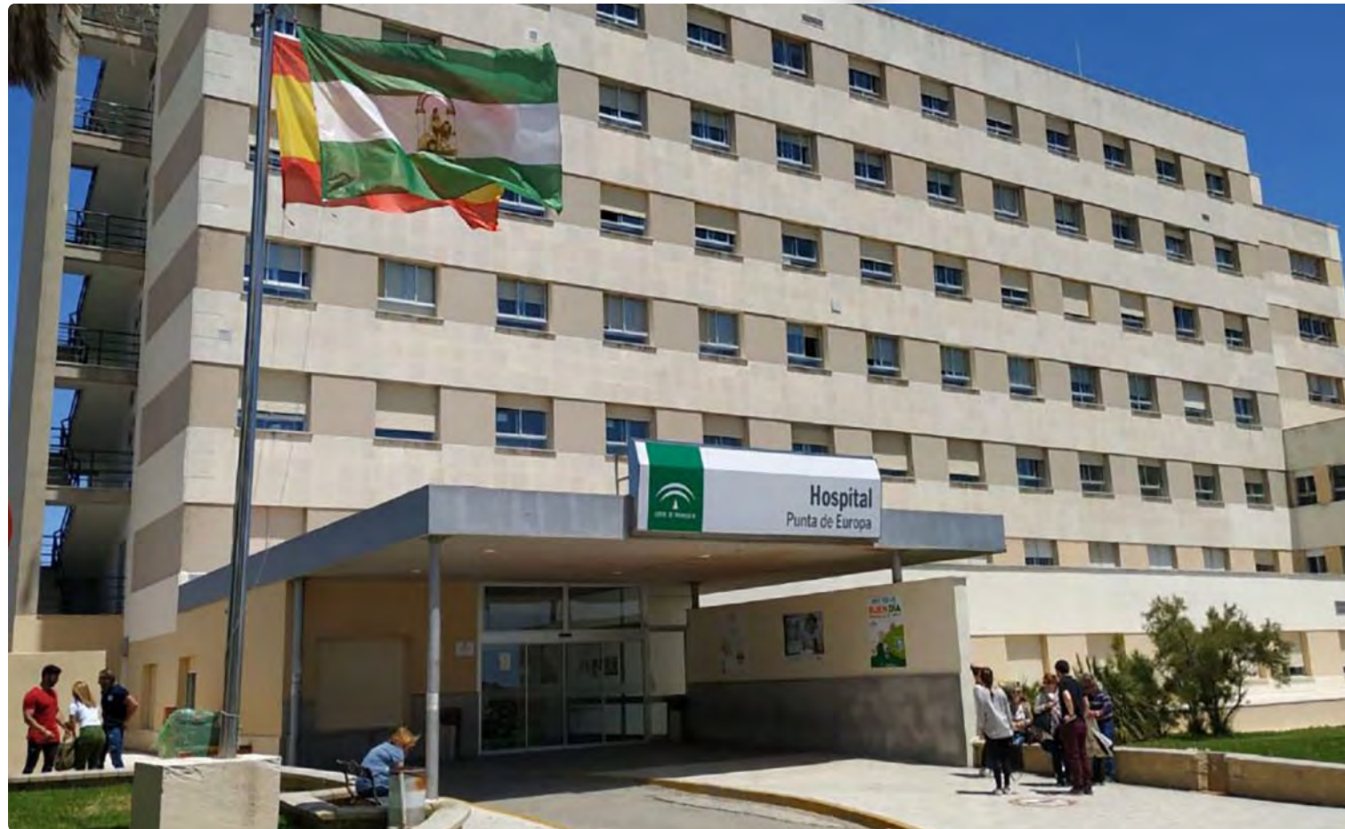
Cuatro de los cinco enfermeros que lideran la investigación trabajan en el Hospital Punta de Europa de Algeciras

El estudio está abanderado por cinco enfermeros con muchas inquietudes y preocupación por cómo afecta esta situación al colectivo. De los cinco, cuatro trabajamos en el Hospital Punta de Europa de Algeciras, y uno en Atención Primaria, en el Centro de Salud Evaristo Domínguez de San Roque. Todos trabajamos en el campo de la Medicina Interna, de la Oncología, Hematología y Cuidados Paliativos y quizás, por la cantidad de situaciones difíciles y dolorosas a las que nos enfrentamos, siempre nos hemos planteado cómo algunas situaciones afectan a la salud mental de nuestro gremio.