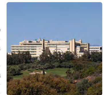
Hospital Costa del Sol