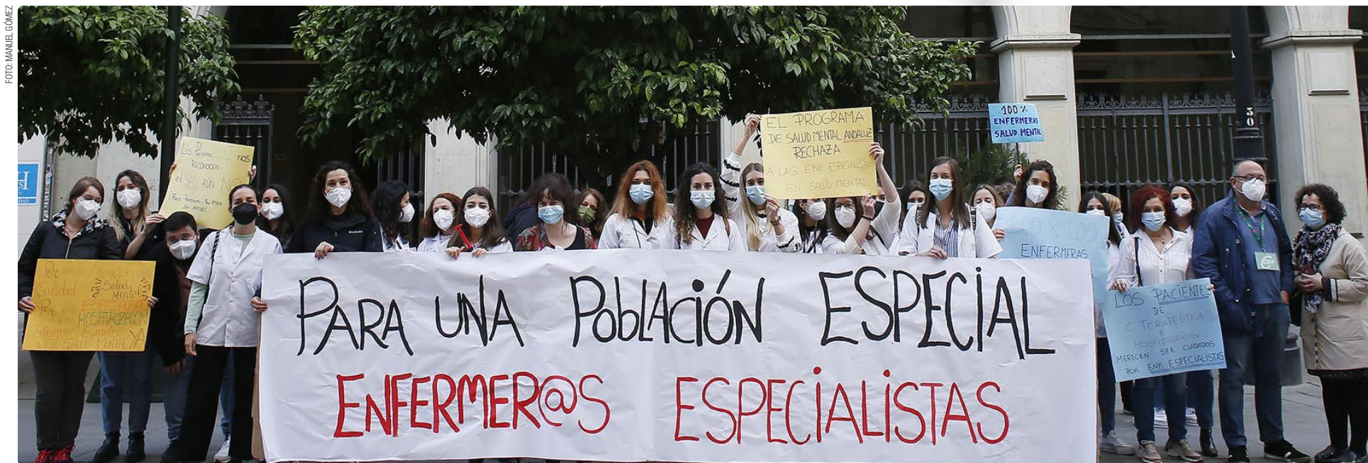
Concentración a las puertas del SAS en Sevilla celebrada a mediados de abril