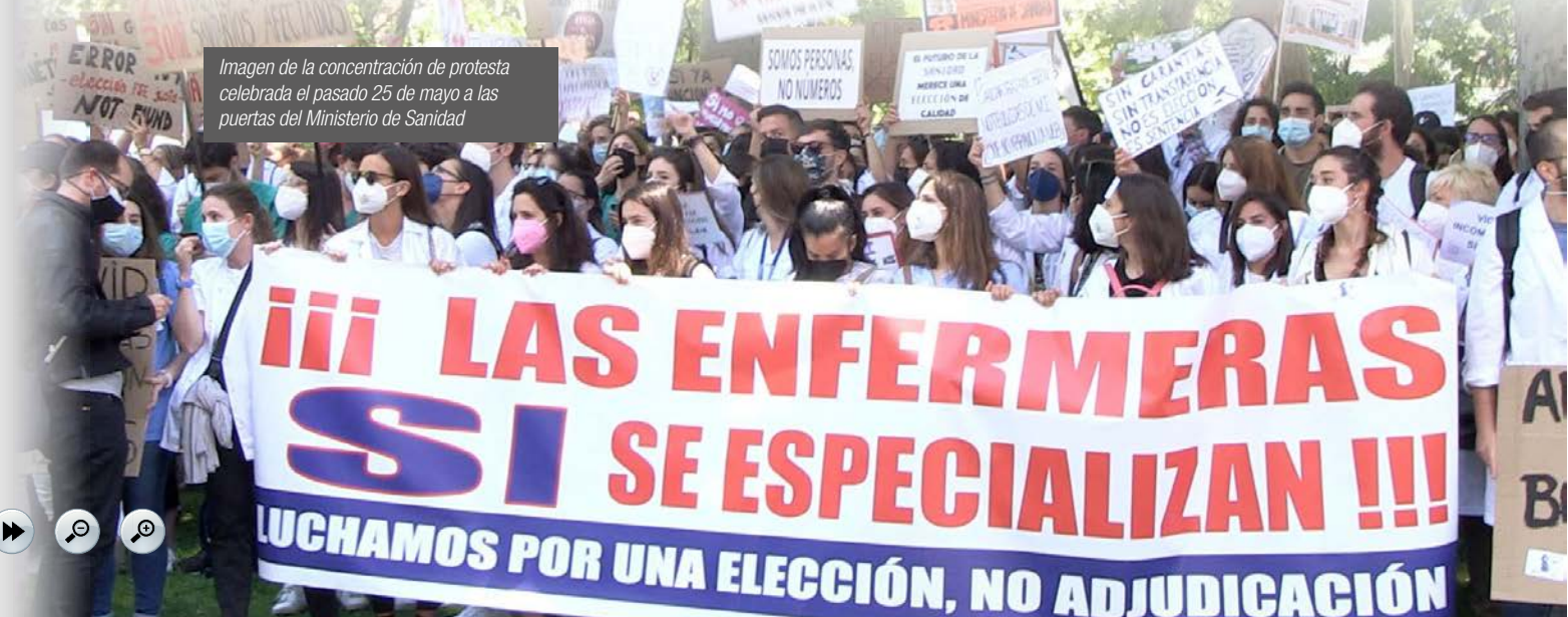
Imagen de la concentración de protesta celebrada el pasado 25 de mayo a las puertas del Ministerio de Sanidad

Conscientes de la indignación de los compañeros afectados, el Consejo Andaluz de Enfermería mostró su absoluto apoyo a la concentración que los futuros residentes realizaron frente al Ministerio de Sanidad el pasado 25 de mayo y 8 de junio.