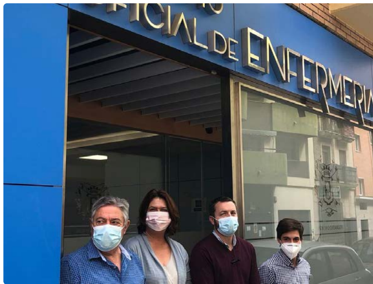
Minuto de silencio en la sede del Colegio de Huelva