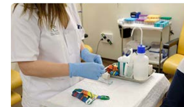
El CAE exige que las nuevas 'Consultas de Acogida' vengán acompañadas de un aumento de plantillas