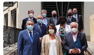
Nuevo Presidente y Comisión Ejecutiva del Consejo Andaluz de Enfermería