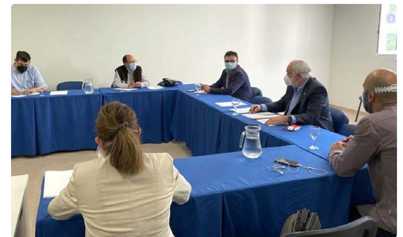
Imagen de la reunión entre responsables del Colegio de Enfermería de Jaén y la FAMPAs 'Los Olivos'

La reunión ha supuesto una primera toma de contacto entre los colectivos interesados para unir fuerzas frente a la Administración y pedir conjuntamente la implantación de la Enfermera Escolar en todos los centros educativos. Para ello, solicitan con urgencia la colaboración entre las Consejerías de Sanidad y de Educación para que impulsen un procedimiento común, participando activamente en políticas sanitarias. La figura de la Enfermera Escolar debe ser la encargada de velar por el cuidado desde el punto de vista de la promoción, prevención y asistencial, la educación y