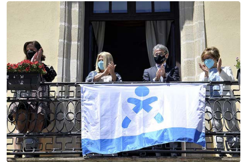
Aplausos en la sede del Ayuntamiento de Jerez, en Cádiz

El Colegio cordobés aprovechó también la jornada para demandar más estabilidad para las enfermeras, y para felicitar a todos los enferme-