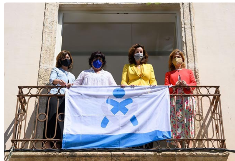
La bandera de la Enfermería en la fachada del Ayuntamiento de Almería

Varios ayuntamientos de Cádiz se sumaron al Colegio de Enfermería gaditano en la conmemoración de este día en homenaje a los más de 8.000 profesionales que forman este colectivo en la provincia. Además de los ayuntamientos, políticos, medios de comunicación, empresas, entidades como el Cádiz Club de Fútbol o los propios ciudadanos quisieron sumarse a la conmemoración inundando las redes sociales de mensajes de cariño y agradecimiento hacia un colectivo que se ha visibilizado más que nunca durante