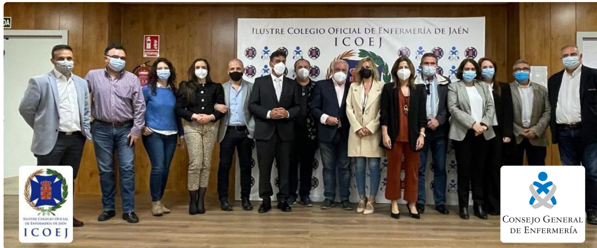
Jurado de este Certamen Nacional de Investigación