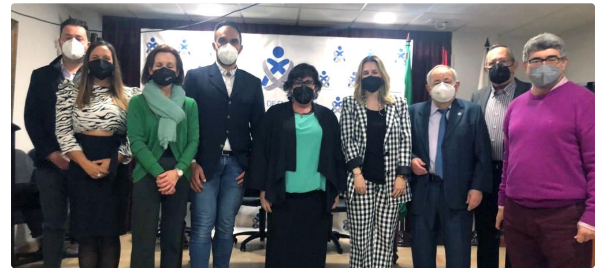
Premiados junto a representantes del Colegio de Enfermería de Almería y de la Asociación de Visitadores Médicos

Las investigaciones premiadas han pasado a engrosar la lista de obras reconocidas en los Premios Investigación de la institución enfermera, que vienen a valorar la gran labor que hace la comunidad enfermera. Desde la institución colegial han trasladado su enhorabuena a todos los premiados, los cuales han sido reconocidos por sus trabajos, frutos de un gran esfuerzo y profesionalidad.