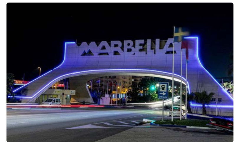
Muchos puntos de la provincia de Málaga, como la entrada a Marbella, se iluminaron de azul

De igual manera, muchos ayuntamientos, colectivos, hospitales y lugares emblemáticos de la provincia se unieron a esta conmemoración. En la noche del 12 de mayo, junto con la sede oficial del Colegio de Enfermería de Málaga, diferentes edificios como el Consistorio de la capital, el Teatro Romano, la Farola del Puerto, el mirador histórico del Jardín Botánico, la Catedral, la Casa natal de Pablo Picasso, el Teatro Romano, el estadio de la Rosaleda o la Plaza de Toros brillaron de azul en honor a las enfermeras malagueñas. ■