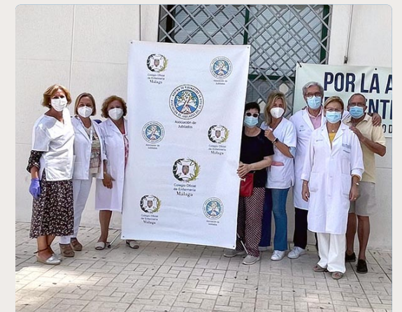
Miembros de la Asociación de Jubilados del Colegio de Málaga y voluntarios en el actual proceso de vacunación

“En una situación de emergencia, hay que ofrecer una solución extraordinaria. Para el colectivo enfermero jubilado poder seguir contribuyendo a la sociedad y volver a realizar una labor que no creíamos que íbamos a hacer, es muy satisfactorio” concluye este profesional de enfermería.