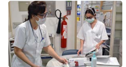
Aprobada la OPE del SAS para 2021, con la que se alcanzan 4.102 plazas para Enfermería