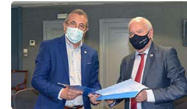
Acuerdo con el Instituto ISFOS para aumentar la formación continua de calidad