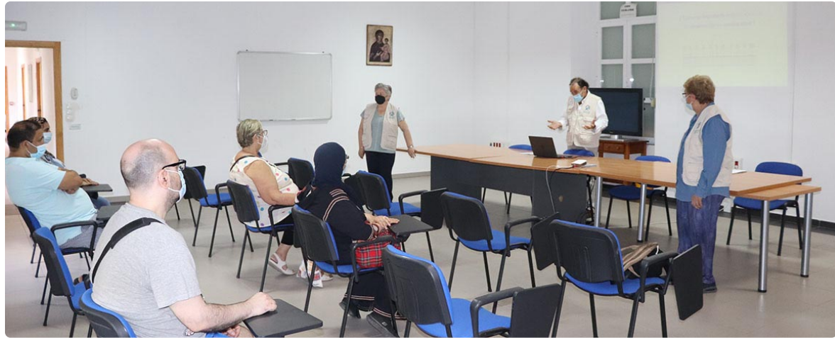
Un momento de la primera charla formativa en la sede de la Fundación Cruz Blanca