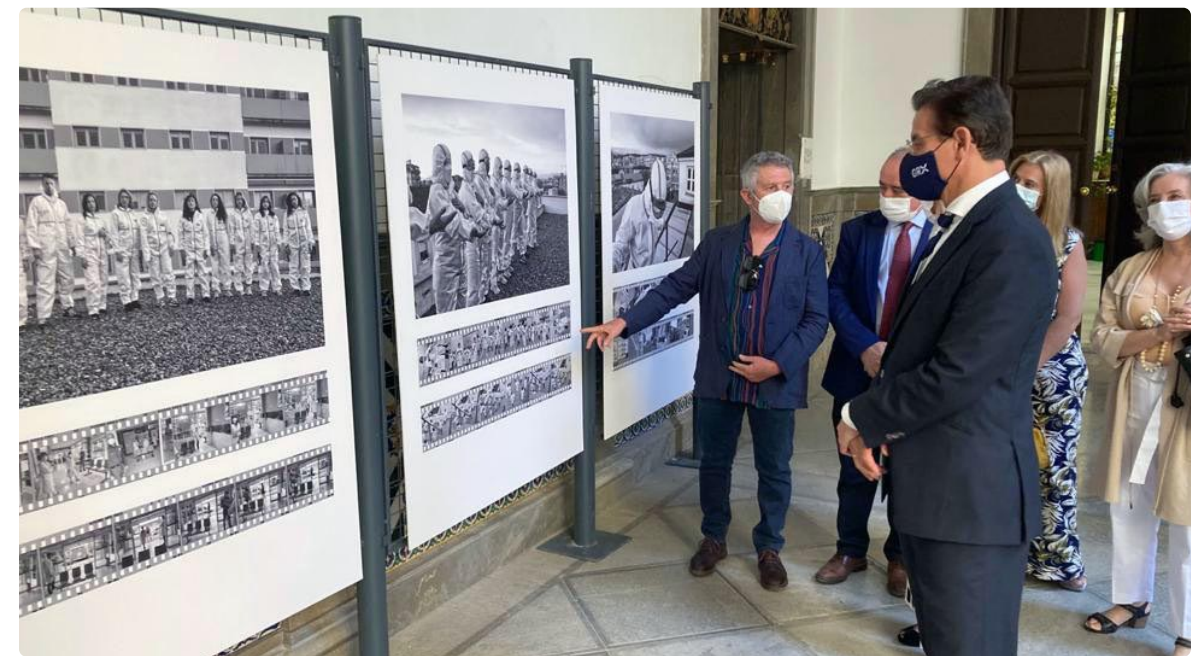
El autor de la muestra explicando los detalles de varias de sus fotografías

El primer edil concluyó mostrando “el máximo reconocimiento de la ciudad, el máximo cariño, la máxima admiración a este colectivo sanitario”.