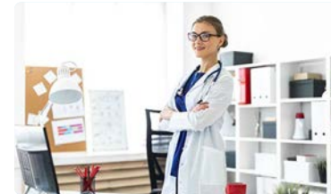
El CAE demanda la publicación de la nueva Orden que permite a las enfermeras ocupar puestos directivos en el SAS