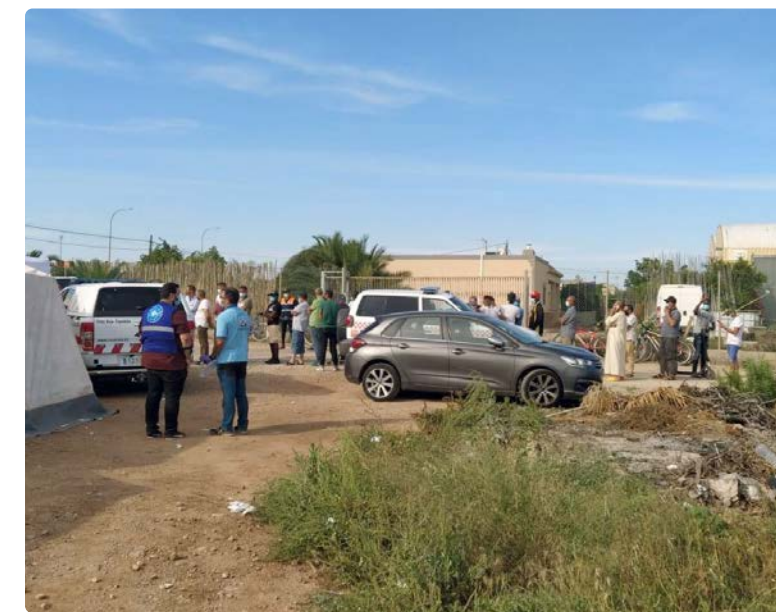
Imágenes del puesto de vacunación habilitado en uno de los asentamientos de Níjar

Todo esto no hubiese sido posible sin la colaboración de ONG's como Almería Acoge, Cepaim o Cruz Roja, que, junto con todo el personal enfermero y sanitario, y Protección