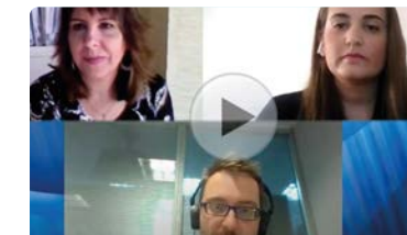
Enfermeras investigadoras de Sevilla hablan sobre cómo influye el grado de dependencia en los cuidados