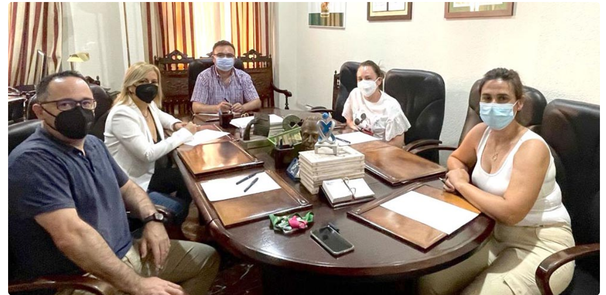
Imagen del nuevo grupo de trabajo constituido