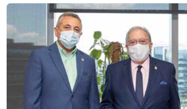
El CAE firma con AMA una póliza de aseguramiento de accidentes para los jubilados voluntarios para vacunar