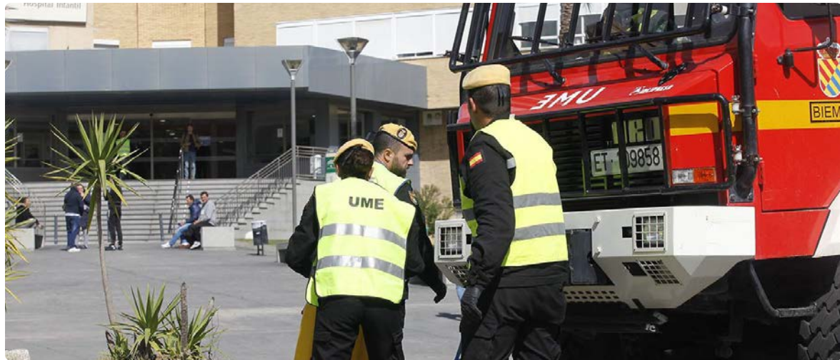
Militares de la UME durante el estado de alarma